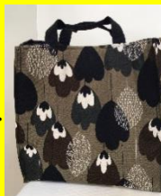
箱型トートバッグ 大800円・小800円