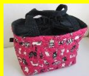
巾着付きバッグ 500円~600円