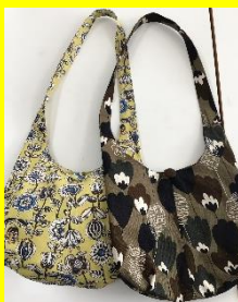
ななめがけショルダー 800円