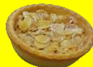
アーモンドタルト 110円